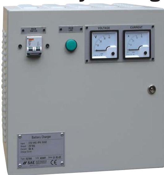
Battery Charger Circuit Circuitazione Caricabatteria